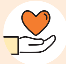
Fahrten & Begleitungen

Damit alles reibungslos funktioniert, sorgen unsere Koordinatorinnen im Hintergrund für eine gute Organisation, einen regelmäßigen Austausch und haben stets ein offenes Ohr für alle Anliegen. Sie organisieren Veranstaltungen und Begegnungen, die Einsamkeit entgegenwirken, den Wissensaustausch fördern und die Vernetzung untereinander stärken.